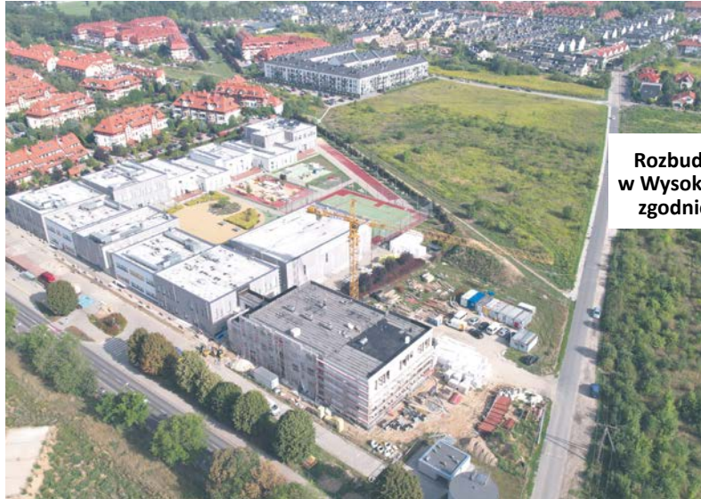
Rozbudowa szkoły w Wysokiej przebiega zgodnie z planem

Uczniowie i wychowankowie szkół Gminy Kobierzyce osiągają świetne rezultaty w nauce, w najbardziej renomowanych wrocławskich liceach – tegoroczna gala stypendialna była rekordowa pod względem ilości wyróżnionych. Skąd taki wysyp talentów?