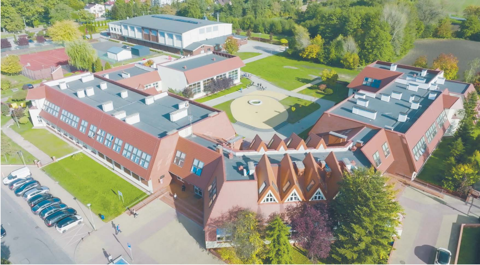
Szkoła w Kobierzycach wzbogaci się o halę sportową z pełnowymiarowym boiskiem do piłki ręcznej

zwykłych szkolnych sal gimnastycznych z kleju stosowanego przez piłkarzy ręcznych jest niezwykle trudne i uciążliwe. Mówimy również o ścianach, trybunach itd.